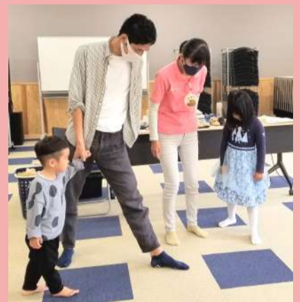
椎葉では、 講座4回計測会3回を実施♪

早く知りたかった！ たくさんの人に知ってほしい！ 夫婦で聞けて、わかりやすい！ 親子で聞けて、楽しかった！ 子どもと自分のためになった！